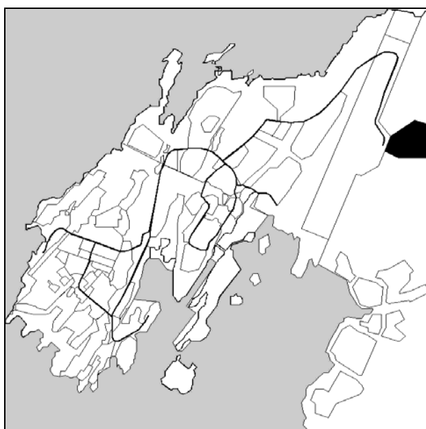
Illoqarfiup ilaanut pilersaarut 4D2-1, Quassussuarmi sisorartarfik.

Kommunalbestyrelsip matumuuna Illoqarfiup ilaanut pilersaarut 4D2-1 atuutivissusaaq saqqummiuppaa, Quassussuarmi sisorartarfik.