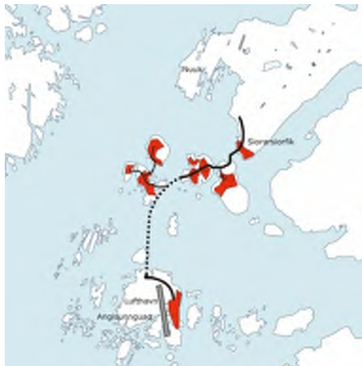
Mittarfeqarfiusinnaasut – Angisunnguamut aaqqiineq