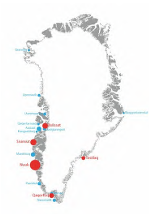
Kalaallit Nunaanni 2001-imiilli illoqarfiit taamaallaat 5-it inuttuseriasimapput

Assilissap taassuma malunnaatilimmik allaanerussutaa tassaavoq Tasiilaq, Kommuneqarfik Sermersuumi tullertut aamma Tunumi pingaamertut ineriartortitsiviusoq. Piffissami pineqartumi illoqarfinnit allanit tamanit, Nuuk eqqaassanngikkaanni, sukkanerusumik 15 %-imik inuttuseriasimasoq. Piffissami pineqartumi illoqarfiit alliaartornerpaat marluk – Nuuk aamma Tasiilaq – taamaallitutik Kommuneqarfik Sermersuumi inissisimapput.