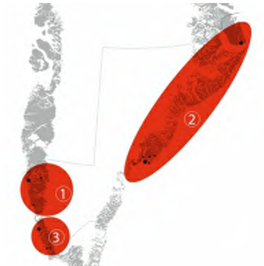
Nunap immikkoortui: 1: Nuuk-eqqaalu, 2: Tasiilaq-eqqaalu, 3: Paamiut-eqqaalu

Quppemerni ataaniittuni nunasseriaaseq, innuttaasut amerliartomerat aamma nunap immikkoortuini pingasuni pingaarmertut iliuusissaq naatsumik allaaserineqarput.