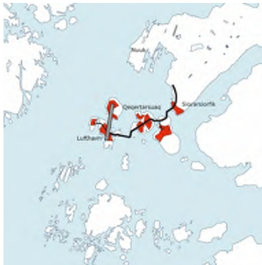
Mittarfeqarfiusinnaasut – Qeqertarsuarmut aaqqiissut